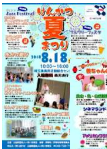
けんかつ夏まつり

<同日開催> 当日は会場の県活および隣接する伊奈町記念公園で様々な催しが行われます!